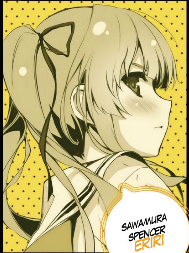
SAWAMURA SPENCER ERIRI