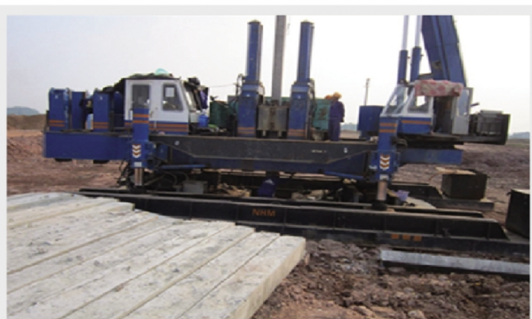
MÁY ÉP CỌC