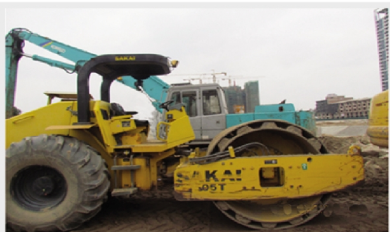
MÁY LU RUNG SAKAI 9T-15T