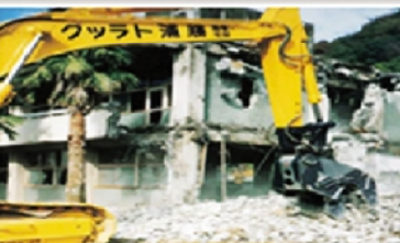
MÁY ĐÀO LẤP ĐẦU BÚA THỦY LỰC