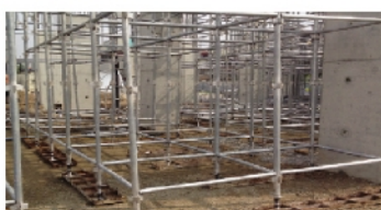
HỆ THỐNG GIÀN GIÁO, VÁN KHUÔN