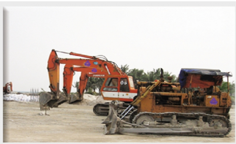
DÀN MÁY ĐÀO VÀ MÁY ỦI