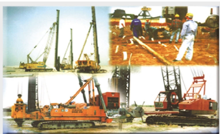
MÁY ĐÓNG CỌC BÊ TÔNG CỌC CÁT VÀ BẮC THẨM