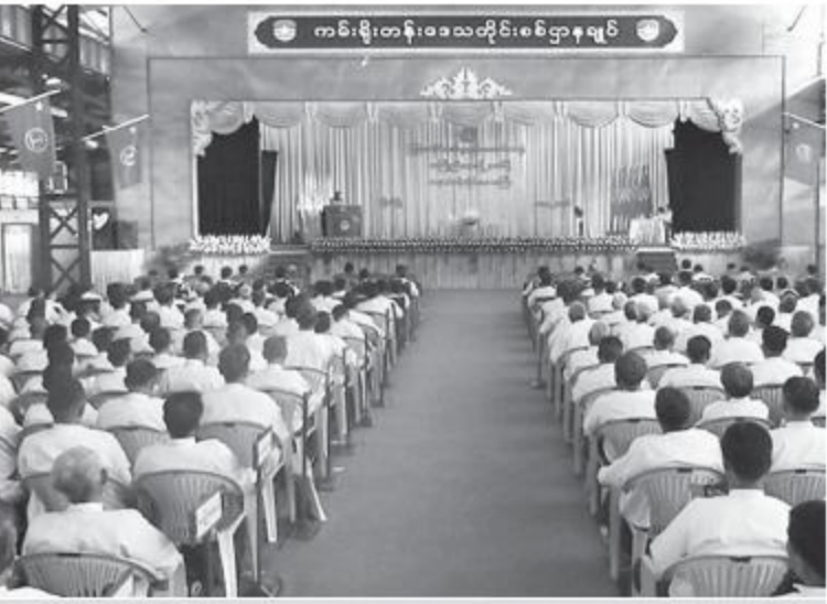
တနင်္သာရီတိုင်းဒေသကြီး၊ စစ်မှုထမ်းဟောင်းအဖွဲ့ အကြံပြုညီလာခံ(၂၀၁၆) ကျင်းပစဉ်။

နေပြည်တော် ၇ ဇူလိုင် ၁၈ မြန်မာနိုင်ငံ စစ်မှုထမ်းဟောင်းအဖွဲ့၊ တနင်္သာရီတိုင်းဒေသကြီး၊ စစ်မှုထမ်းဟောင်း အဖွဲ့အကြံပြုညီလာခံ(၂၀၁၆)ကို ယနေ့နံနက်ပိုင်း တွင် ကမ်းရိုးတန်းဒေသတိုင်းစစ်ဌာနချုပ်၊ တိုင်းရန်အောင်ခန်းမ၌ ပြုလုပ်ရာ တိုင်းမှူး ဗိုလ်မှူးချုပ်မောင်မောင်စိုးနှင့် တာဝန်ရှိသူ များ၊ စစ်မှုထမ်းဟောင်းအဖွဲ့ဝင်များနှင့် ဖိတ်ကြားထားသူများ တက်ရောက်ကြပြီး တိုင်းမှူးက အမှာစကားပြောကြားသည်။ ထို့နောက် စစ်မှုထမ်းဟောင်းအဖွဲ့ဝင်များ နှင့် ၂၀၁၅-၂၀၁၆ ပညာသင်နှစ် တက္ကသိုလ်ဝင် စာမေးပွဲအောင်မြင်ခဲ့သော စစ်မှုထမ်း ဟောင်း သား၊ သမီးများအတွက် ဂုဏ်ပြုငွေ များပေးအပ်သည်။ ထို့ပြင် အလှူရှင်များ ကိုယ်စားပြုသော စစ်မှုထမ်းဟောင်းအဖွဲ့အတွက် အလှူငွေများပေးအပ်၍ စစ်မှုထမ်းဟောင်း အဖွဲ့များမှ ကရုဏာကမ္ဘာ့ဘိုးဘွားရိပ်သာ အတွက် အလှူငွေများပေးအပ်ကြသည်။ ယင်းနောက် အစည်းအဝေးကို ဆက်လက် ပြုလုပ်ရာ စစ်မှုထမ်းဟောင်းသဘာပတိက အမှာစကားပြောကြားပြီး စစ်မှုထမ်းဟောင်း အဖွဲ့ဝင် ကိုယ်စားလှယ်များက ရွှေလုပ်ငန်း စဉ် (၇) ရပ်ချမှတ်ဆောင်ရွက်ခဲ့ကြသည်။ ထို့ပြင် စစ်မှုထမ်းဟောင်းအဖွဲ့ဝင်များအား နယ်မြေခံဆေးကုသရေးအဖွဲ့က ရောဂါရှာဖွေ ပေးခြင်းနှင့် ကျန်းမာရေးစစ်ဆေးခြင်း များဆောင်ရွက်ပေးခဲ့ကြောင်း သတင်းရရှိ သည်။ (၁၀၀)