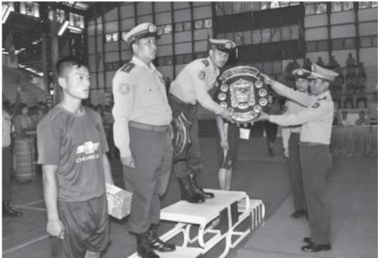
အရှေ့မြောက်တိုင်းစစ်ဌာနချုပ် တိုင်းမှူး ဗိုလ်မှူးချုပ်ဖုန်းမြတ် တိုင်းမှူးခိုင်း ပြေးခုန်ပစ်ပြိုင်ပွဲတွင် အကောင်းဆုံးတိုင်းမှူးခိုင်းဆုရရှိသောအသင်းအား ဆုပေးအပ်ခဲ့ခြင်းဖြစ်သည်။

နေပြည်တော် ၇ ဇူလိုင် ၁၈ အရှေ့မြောက်တိုင်းစစ်ဌာနချုပ် တိုင်းမှူးခိုင်း ပြေးခုန်ပစ်ပြိုင်ပွဲ ဆုပေးပွဲကို ယနေ့ နေ့လယ်ပိုင်းတွင် တိုင်းစစ်ဌာနချုပ် အားကစားရုံ၌ ပြုလုပ်ရာ တိုင်းမှူး ဗိုလ်မှူးချုပ် ဖုန်းမြတ်နှင့် တာဝန်ရှိသူများ တက်ရောက် တက်ပွဲ မှုးများ၊ အရာရှိ၊ စစ်သည်၊ မိသားစုများ၊ ဗိုလ် အဖွဲ့များ၊ ပြိုင်ပွဲဝင်အားကစားသမားများနှင့် အားကစားဝါသနာရှင်များ တက်ရောက်ကြ သည်။ ဆုပေးပွဲတွင် တိုင်းမှူးနှင့်တာဝန်ရှိသူများ က အကောင်းဆုံးတိုင်းမှူးခိုင်းဆုရရှိသော အသင်းအား တံခွန်ခိုင်းခိုင်းနှင့်ဂုဏ်ပြုဆုငွေ ကိုလည်းကောင်း၊ ဗိုလ်အဖွဲ့အား ဂုဏ်ပြုငွေ ကိုလည်းကောင်း အသီးသီးပေးအပ်ခဲ့ခြင်း ဖြစ်ပြီး သတင်းရရှိသည်။ (၁၀၀)