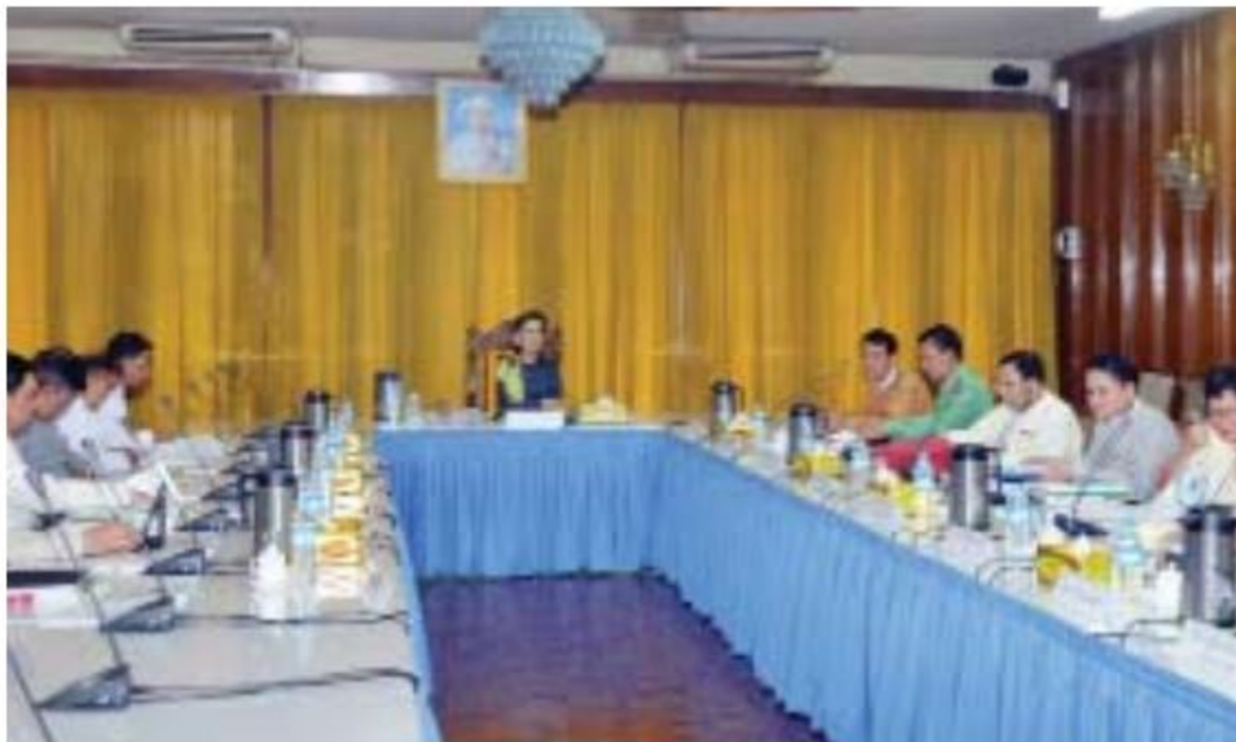
နိုင်ငံတော်၏အတိုင်ပင်ခံပုဂ္ဂိုလ် ဒေါ်အောင်ဆန်းစုကြည် ပြည်ထောင်စုဝန်ကြီးများ၊ ရန်ကုန်တိုင်းဒေသကြီးဝန်ကြီးချုပ်နှင့် တိုင်းဒေသကြီးဝန်ကြီးများနှင့်တွေ့ဆုံစဉ်။

နေပြည်တော် ၈ ဇူလိုင် ၁၈ နိုင်ငံတော်၏အတိုင်ပင်ခံပုဂ္ဂိုလ် ဒေါ်အောင်ဆန်းစုကြည်သည် ပြည်ထောင်စုဝန်ကြီးများ၊ ရန်ကုန်တိုင်းဒေသကြီးဝန်ကြီးချုပ်နှင့် တိုင်းဒေသကြီးဝန်ကြီးများအား ယနေ့ နံနက် ၁၀ နာရီတွင် ရန်ကုန်တိုင်းဒေသကြီး အစိုးရအဖွဲ့ခန်းမတွင် အစည်းအဝေးခန်းမ(၁)၌ တွေ့ဆုံသည်။ တွေ့ဆုံစဉ် နိုင်ငံတော်၏အတိုင်ပင်ခံပုဂ္ဂိုလ်က ရေတို၊ ရေရှည်ဆောင်ရွက်ရမည့်လုပ်ငန်းများနှင့် ပြည်ထောင်စုအစိုးရအဖွဲ့သို့တင်ပြ၍ နိုင်ငံတော်ဝန်ထမ်းတိုက်ရိုက်ပေါင်းစပ်ဆောင်ရွက်ရမည့်လုပ်ငန်းများကို စနစ်တကျ စီမံခန့်ခွဲ၍ တည်ဆဲဥပဒေ၊ နည်းဥပဒေများကိုလိုက်နာပြီး ဒေသဖွံ့ဖြိုးတိုးတက်ရေးကို ကြိုးပမ်းဆောင်ရွက်ကြရန် မှာကြားသည်။ တွေ့ဆုံပွဲသို့ ပြည်ထောင်စုဝန်ကြီး ဒေါက်တာအောင်သူ၊ ဦးသန့်စင်မောင်၊ ဦးခင်မောင်ချို၊ ဦးဝင်းခိုင်၊ ရန်ကုန်တိုင်းဒေသကြီးဝန်ကြီးချုပ် ဦးမြိုးမင်းသိန်း၊ ဒုတိယဝန်ကြီး ဦးမောင်မောင်ဝင်းနှင့် တိုင်းဒေသကြီးဝန်ကြီးများ တက်ရောက်ကြသည်။ (သတင်းစဉ်)