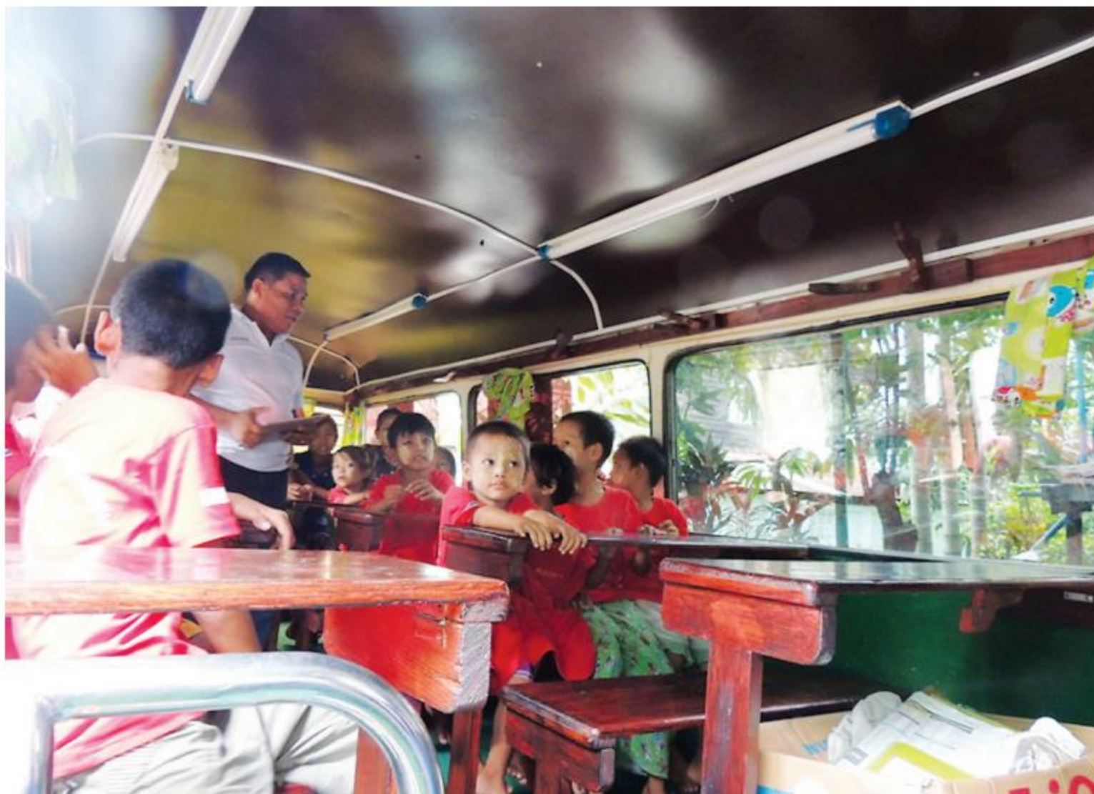
myME hosts a group of street children for a lesson on a bus in Yangon.