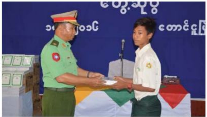
တောင်ပိုင်းတိုင်းစစ်ဌာနချုပ် တိုင်းမှူး ဗိုလ်မှူးချုပ်မြတ်ကျော် ကျောင်းသား၊ ကျောင်းသူများအတွက် ကျောင်းသုံးပလာစတစ်အုပ်ပေးအပ်စဉ်။

နေပြည်တော် ၇ ဇူလိုင် ၁၈ ပဲခူးတိုင်းဒေသကြီး၊ တောင်ငူမြို့နယ်