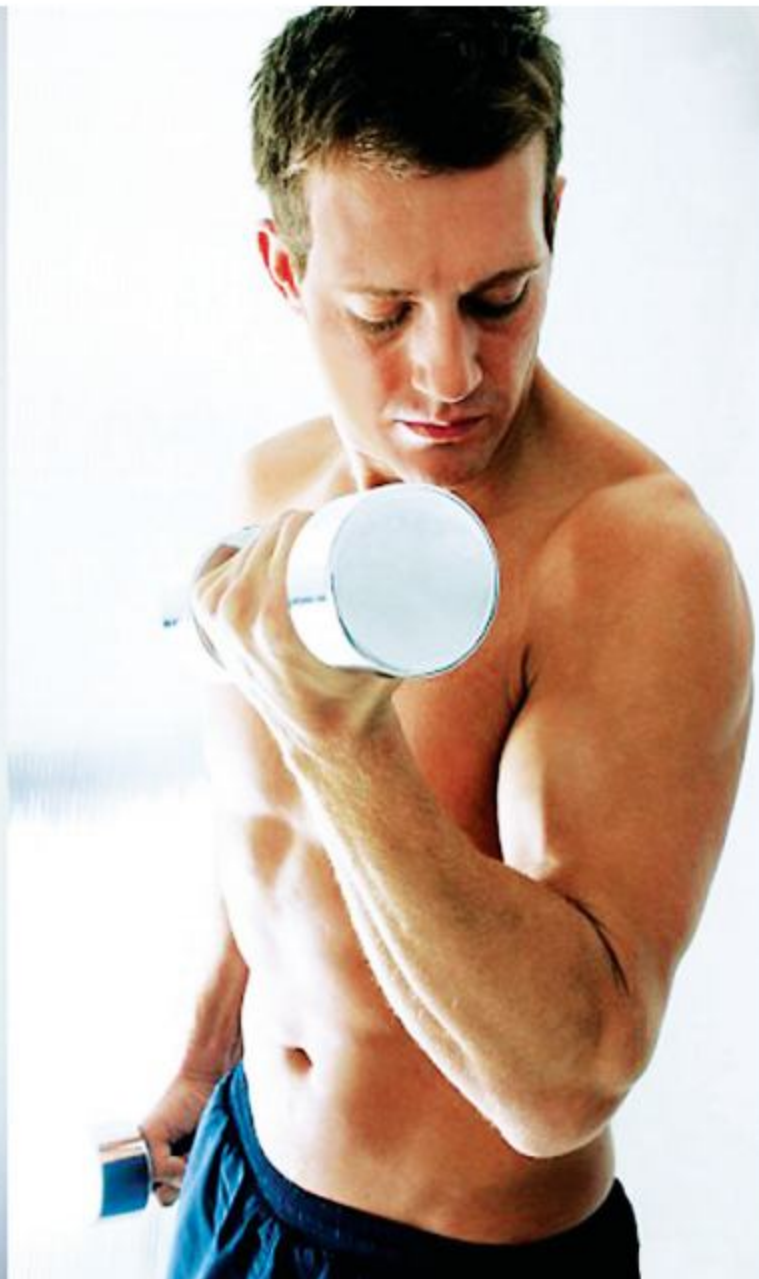
All exercise burns calories, but lifting weights has been found to be more effective in burning body fat.