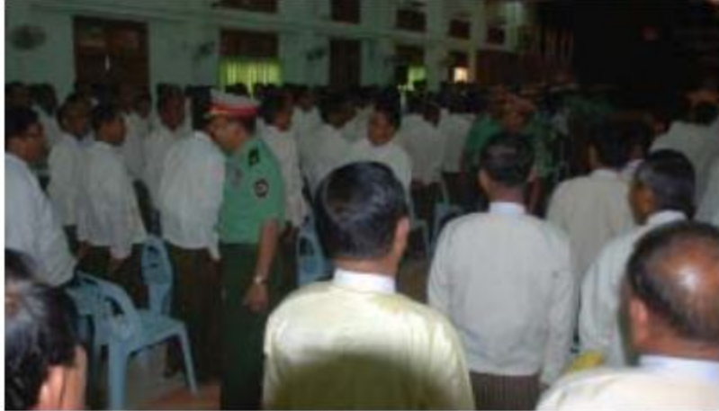
နေပြည်တော်တိုင်းစစ်ဌာနချုပ် တိုင်းမှူး ဗိုလ်မှူးချုပ်မြင့်ထွန်း စစ်မှုထမ်းဟောင်းအဖွဲ့ဝင်များအား ရင်းရင်းနှီးနှီးဆက်စဉ်။

နေပြည်တော် ၇ ဇူလိုင် ၁၈ မြန်မာနိုင်ငံစစ်မှုထမ်းဟောင်းကြီးကြပ်ရေးအဖွဲ့ အကြံပြုညီလာခံ ၂၀၁၆ (နေပြည်တော်) ကို ယနေ့နေ့လယ်ပိုင်းတွင် တိုင်းစစ်ဌာနချုပ် အောင်ငြိမ်းအေးခန်းမ၌ပြုလုပ်ရာ နေပြည်တော် စစ်မှုထမ်းဟောင်းကြီးကြပ်ရေးအဖွဲ့ နာယက နေပြည်တော်တိုင်းစစ်ဌာနချုပ် တိုင်းမှူး ဗိုလ်မှူးချုပ်မြင့်ထွန်းနှင့် တပ်မတော်အရာရှိကြီးများ၊ ပျဉ်းမနား၊ လယ်ဝေး၊ တပ်ကုန်းမြို့နယ်များမှ ကိုယ်စားလှယ်များနှင့် စစ်မှုထမ်းဟောင်းအဖွဲ့ဝင်များ တက်ရောက်ကြသည်။ ဦးစွာ တိုင်းမှူးနှင့် စစ်မှုထမ်းဟောင်းကြီးကြပ်ရေးအဖွဲ့ဥက္ကဋ္ဌတို့က အမှာစကားပြောကြားသည်။ ထို့နောက် မြန်မာနိုင်ငံစစ်မှုထမ်းဟောင်းအဖွဲ့အကြံပြုညီလာခံ ၂၀၁၆ (နေပြည်တော်)၏ ရှေ့လုပ်ငန်းစဉ် ၇ ရပ်