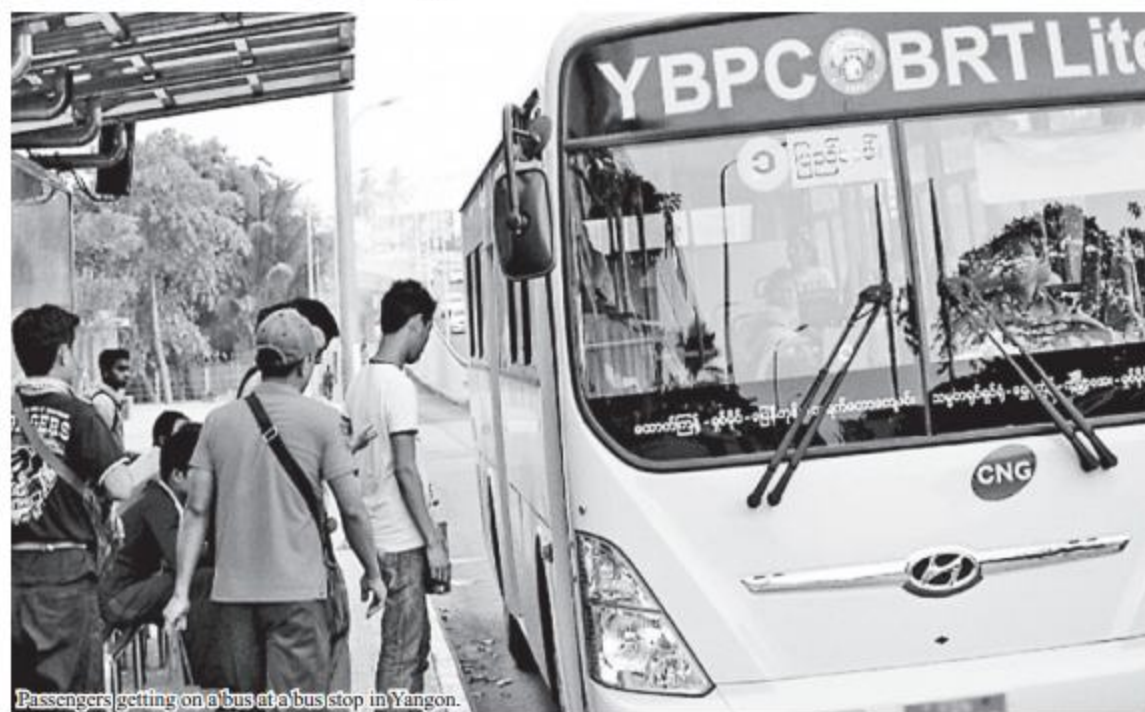
Passengers getting on a bus at a bus stop in Yangon.

BRT-Lite operates on route-1 along Pyay Road with 18 buses and on route-2 along Kaba Aye Pagoda Road with 27 buses. There are 23 bus stops on the route-1 and 27 on route-2. The Yangon Public Bus Company launched operation with