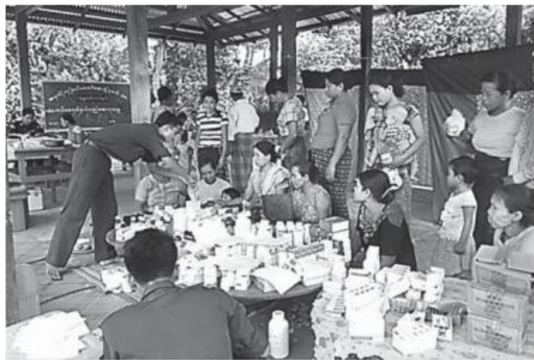
အနောက်မြောက်တိုင်းစစ်ဌာနချုပ် နယ်လှည့်ဆေးကုသရေးအဖွဲ့၊ ရေဘေးသင့်ဒေသများရှိ ဒေသခံပြည်သူများအား ကျန်းမာရေးစောင့်ရှောက်မှုလုပ်ငန်းများ ဆောင်ရွက်ပေးစဉ်။

နေပြည်တော် ၇ ဇူလိုင် ၁၈ ရောဂါတိုက်ရိုက်ဖြစ်ပွားမှုကို ကာကွယ်ရန်နှင့် ရောဂါလျက်ရှိသော မကွေးတိုင်းဒေသကြီး၊ ပခုက္ကူမြို့နယ်၊ ဆိတ်ခွာကျေးရွာအုပ်စု၊ အရှေ့ သီရိကျေးရွာနှင့် ပတ်ဝန်းကျင်ကျေးရွာတို့မှ ဒေသခံပြည်သူများအား ယနေ့တွင် အနောက် မြောက်တိုင်းစစ်ဌာနချုပ် နယ်လှည့်ဆေးကုသ ရေးအဖွဲ့က ကျန်းမာရေးစောင့်ရှောက်မှု လုပ်ငန်းများဆောင်ရွက်ပေးရာ သွေးတိုး ရောဂါ၊ သွေးကျရောဂါ၊ မျက်စိရောဂါ၊ ဆီး