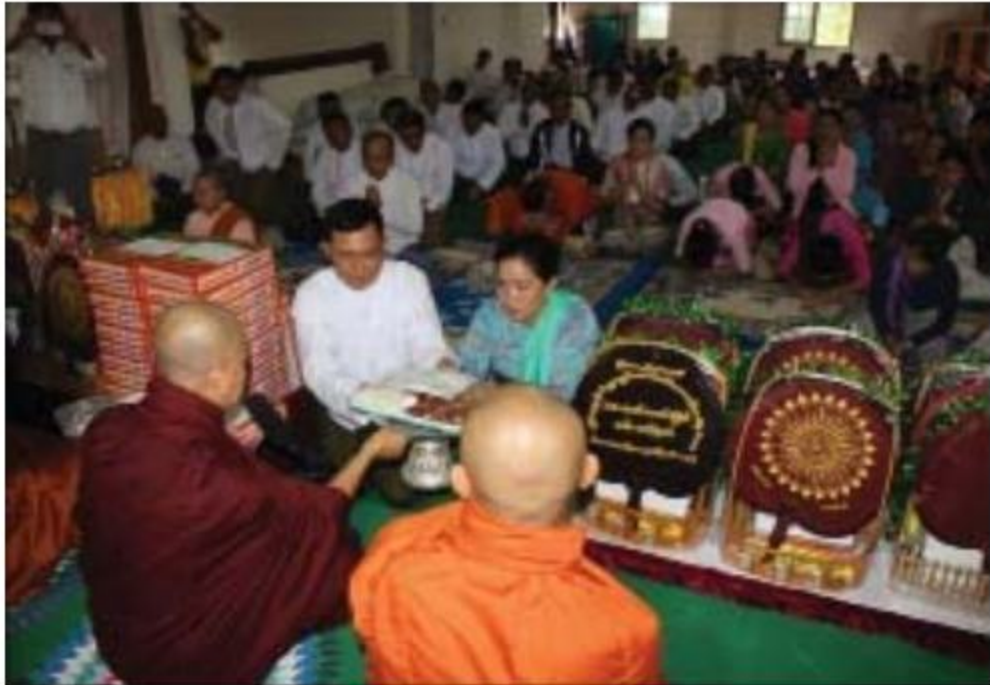
တြိဂံဒေသတိုင်းစစ်ဌာနချုပ် တိုင်းမှူး ဗိုလ်မှူးချုပ်အောင်ဇော်အေး သံဃာတော်များအား ဝါဆိုသင်္ကန်းဆက်ကပ်လှူဒါန်းစဉ်။

နေပြည်တော် ၇ ဇူလိုင် ၁၈ တြိဂံဒေသတိုင်းစစ်ဌာနချုပ်၏ ဝါဆိုသင်္ကန်းဆက်ကပ်လှူဒါန်းခြင်းကို ယနေ့နံနက်ပိုင်းတွင် တိုင်းစစ်ဌာနချုပ် ပြည်ငြိမ်းအေးခန်းမ၌ပြုလုပ်ရာ ကျိုင်းယဉ်ကျောင်းတိုက်ဆရာတော် အဂ္ဂမဟာသဒ္ဓမ္မဇောတိကဓဇ ဘဒ္ဒန္တဓမ္မစာရ အမှုပြုသော သံဃာတော်များ ကြွရောက်တော်မူကြပြီး တိုင်းမှူး ဗိုလ်မှူးချုပ်အောင်ဇော်အေးနှင့် တာဝန်ရှိသူများ၊ ဌာနဆိုင်ရာမှ တာဝန်ရှိသူများနှင့် အရာရှိ၊ စစ်သည်၊ မိသားစုများ တက်ရောက်ကြသည်။ ဦးစွာ တိုင်းမှူးနှင့် တက်ရောက်လာသူများက ကျိုင်းယဉ်ကျောင်းတိုက်ဆရာတော်ထံမှ ငါးပါးသီလခံယူဆောက်တည်ကြသည်။ ထို့နောက် သံဃာတော်များအား ဝါဆိုသင်္ကန်းနှင့်လှူဖွယ်ပစ္စည်းများ ဆက်ကပ်လှူဒါန်းပြီး နေ့ဆွမ်းဆက်ကပ်လှူဒါန်းကြသည်။ အလားတူ ရှမ်းပြည်နယ်(အရှေ့ပိုင်း) ကျိုင်းတုံမြို့၊ ရပ်တော်မူထေရဝါဒဗုဒ္ဓသာသနာပြု(ဗဟို)ကျောင်း တောင်တန်းသာသနာပြုထောက်ပံ့ရေးအသင်း၏ပထမအကြိမ် ဝါဆိုသင်္ကန်း၊ ဆန်၊ ဆီနှင့် လှူဖွယ်ပစ္စည်းများ ဆက်ကပ်လှူဒါန်းခြင်းကို ၇ ဇူလိုင် ၁၇ ရက်