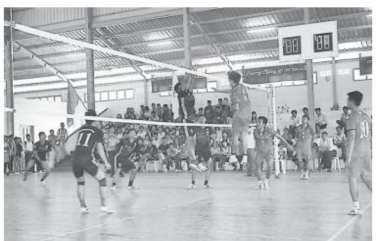
နေတက္ကသိုလ်၊ ကလေးတက္ကသိုလ်၊ ရွှေဘိုတက္ကသိုလ်၊ စစ်ကိုင်းတက္ကသိုလ်တို့မှ အမျိုးသား ခြောက်သင်း၊ အမျိုးသမီး ငါးသင်းတို့ ပါဝင်ယှဉ်ပြိုင်ပွဲကြောင်း သိရသည်။ (၆၁၁)

မုံရွာနှင့်တက္ကသိုလ်ပေါင်းစုံအမျိုးသား၊ အမျိုးသမီးဘော်လီဘောပြိုင်ပွဲကို စစ်ကိုင်းတိုင်းဒေသကြီးအတွင်းရှိ မုံရွာတက္ကသိုလ်၊ မုံရွာစီးပွားရေးတက္ကသိုလ်၊ စစ်ကိုင်းပညာ